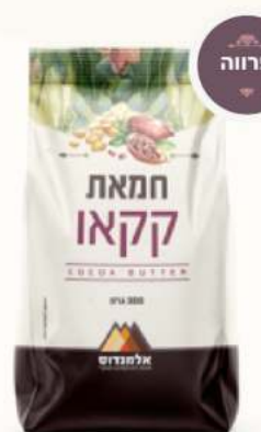
חמאת קקאו מק"ט: 3691