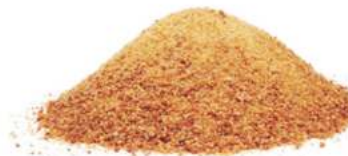
סוכר קוקוס אורגני 20 / 1 ק"ג