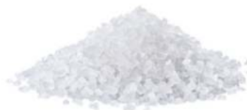
איזומלט 20 ק"ג