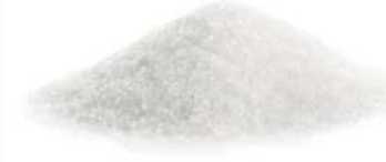
מלטיטול 25 ק"ג