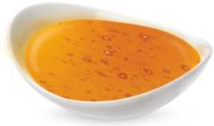
דבש טהור 25 ק"ג