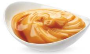
ריבת חלב קומידה 10 ק"ג