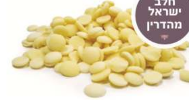
שוקולד לבן מהדרין בית יוסף 29% מוצרי קקאו 1 / 10 ק"ג