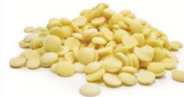
שוקולד לבן 32% מטבעות 10 ק"ג