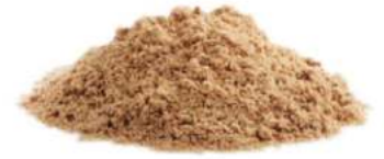
סוכר חום דמררה 25 / 1 ק"ג