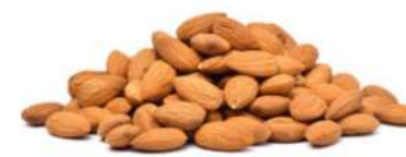
שקד טבעי אמריקאי 22.7 ק"ג