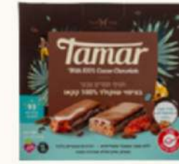
תמר מצופה שוקולד 100% קקאו