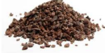
פולי קקאו גרוסים נא 20 ק"ג