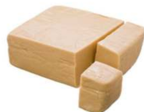
מרציפן #215 DANISHLUBECA 12.5 ק"ג