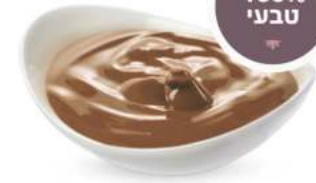
100% טבעי חמאת לוז 5 ק"ג