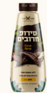
סירופ חרובים טבעי בקבור לחיץ מק"ט: 498436