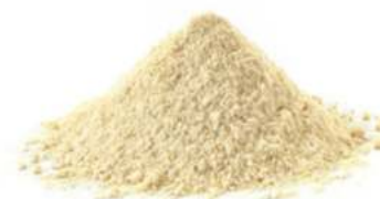
שקד מולבן טחון 11.35 / 1 ק"ג