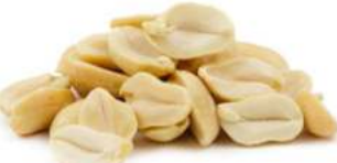
בוטנים חצאים מולבנים 25 / 1 ק"ג