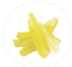
רצועות לימון 4 ק"ג