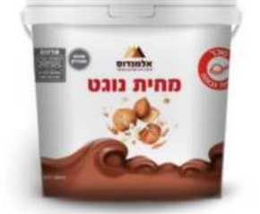
מחית נוגט 6 ק"ג