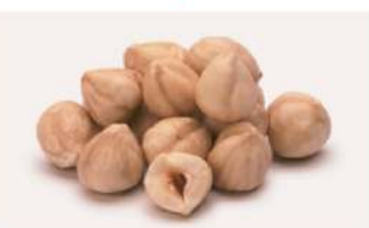
אגוז לוז מולבן קלוי 1 ק"ג