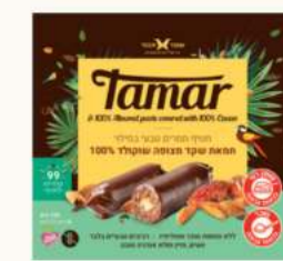
תמר במילוי מחית שקדים בציפוי שוקולד 100% קקאו