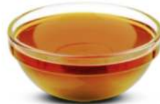
סירופ אגבה אורגני 350 גרם