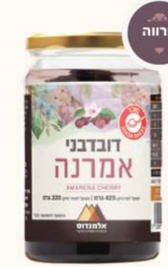
דובדבני אמרנה מק"ט: 30014