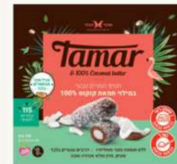
תמר במילוי מחית קוקוס