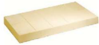
ADM חממת קקאו 25 ק"ג