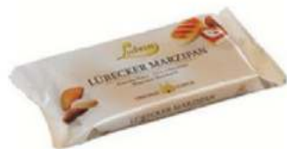
מרציפן אריזה קמעונאית מארז 15 יחידות של 200 גרם