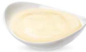
חלב מרוכז 10 ק"ג