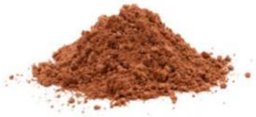
12-10 קקאו DE ZAAAN D-11-S 25 ק"ג