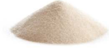
ג'לטין דגים 25 / 1 ק"ג