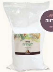
סודה לשתייה מק"ט: 210