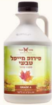
סירופ מיפל טבעי מק"ט: 178548