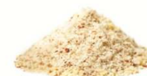
שקד טבעי גרוס 2-4 מ"מ 11.35 / 1 ק"ג