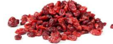
חמוציות ללא סוכר 11.35 / 1 ק"ג