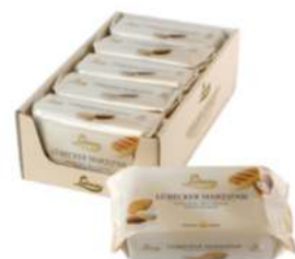
מרציפן פרימיום 52% 1 ק"ג במארז 5 יחידות