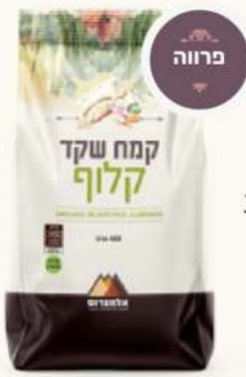
שקד מולבן טחון מק"ט: 941 / 3687