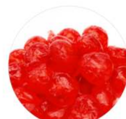
דובדבן אדום 5 ק"ג