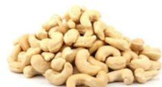
קשיו טבעי שלם - 320 22.7 / 1 ק"ג