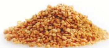
קרוקנט לוז 1 ק"ג במארז 10 ק"ג