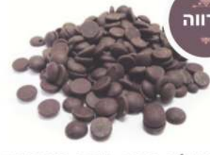
שוקולד מריר 85% מטבעות - GHANA - 1 / 2.5 ק"ג