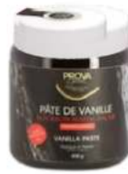
מחית וניל טהורה בורבון 500 גרם