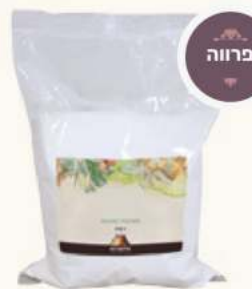
סוכר וניל מק"ט: 470