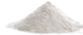
סודה לשתייה 1 ק"ג