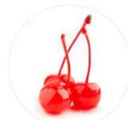
דובדבן עם גבעול 3 ק"ג