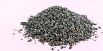
פרג שלם 25 / 1 ק"ג