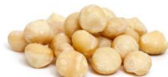
מקדמיה 11.35 ק"ג