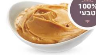
100% טבעי חמאת בוטנים 5 ק"ג