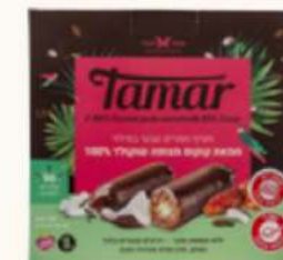
תמר במילוי חמאת קוקוס בציפוי שוקולד 100% קקאו