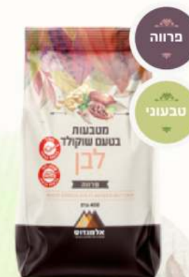
מטבעות בטעם שוקולד לבן - פרווה מק"ט: 3731