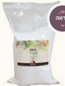
אבקות סוכר מק"ט: 274