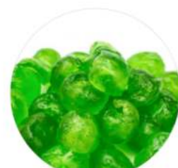
דובדבן ירוק 5 ק"ג