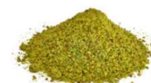
פיסטוק גרוס 2-4 1 ק"ג