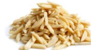
שקד מקלות 11.35 / 1 ק"ג