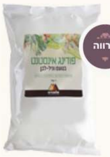
אבקות פודינג וניל מק"ט: 528