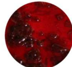
וריגטו אמרנה 3.5 ק"ג