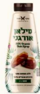
סירופ סילאן אורגני בקבוק לחיץ מק"ט: 3221