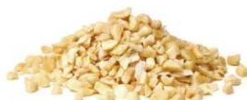
אגוז לוז מולבן גרוס 10 / 1 ק"ג