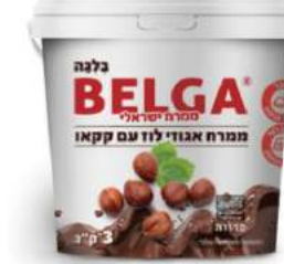
ממרח BELGA קקאו ואגוזי לוז 6 ק"ג