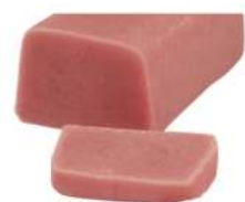
מרציפן רובי 1 ק"ג במארז 5 יחידות