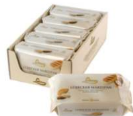
מרציפן 33% מארז 5 יחידות 12.5 ק"ג