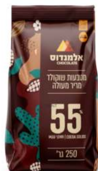
שוקולד מריר 55% 10 ק"ג