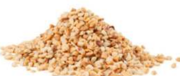
בוטנים גרוסים קלויים 7.5 ק"ג