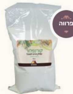
קורנפלור מק"ט: 229