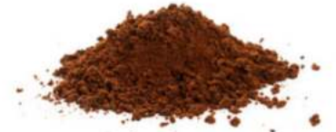
RAW אבקת קקאו אורגני 14-16% 25 ק"ג