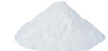
אבקת אפיה 1 ק"ג