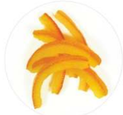
רצועות תפוז 4 ק"ג