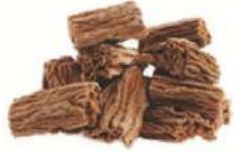
מקופלת חום 5 ק"ג