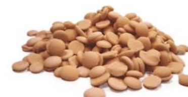
שוקולד קרמל 2.5 ק"ג