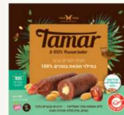
תמר במילוי חמאת בוטנים