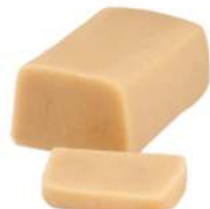
מרציפן אורגני #042 1 ק"ג במארז 5 יחידות