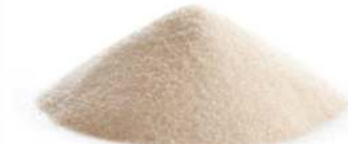
אגר אגר 5 ק"ג