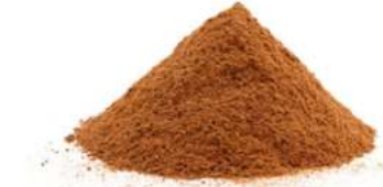
קימון טחון 1 ק"ג