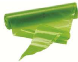
שקיות זילוף 74 יח'