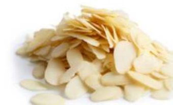
שקד פרוס אמריקאי 11.35 / 1 ק"ג