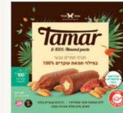
תמר במילוי מחית שקדים