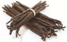
מקלות וניל - בורבון מדגסקר ארוז 250 גרם / 1 ק"ג