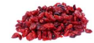
חמוציות חצאים 11.35 / 1 ק"ג