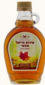
סירופ מיפל 100% טבעי מק"ט: 178549