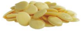
שוקולד לבן פרווה 10 ק"ג