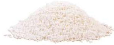
סוכר גבישי בינוני P×4 / P×2 25 / 1 ק"ג