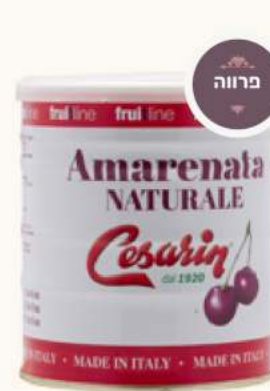
דובדבני אמרנה מק"ט: 6358 / 328