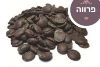
שוקולד מריר 55% מטבעות 1 / 2.5 / 10 ק"ג