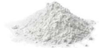
קורנפלור 25 / 1 ק"ג