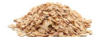
שיבולת שועל 25 / 1 ק"ג