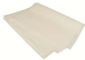
נייר אפייה לבן סליקון 60x40 1000 יח'