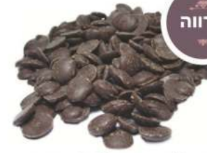
שוקולד מריר 70% מטבעות 1 / 2.5 / 10 ק"ג