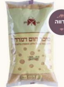
סוכר דמררה מק"ט: 420