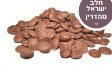
שוקולד חלב מהדרין בית יוסף 35% 1 / 10 ק"ג