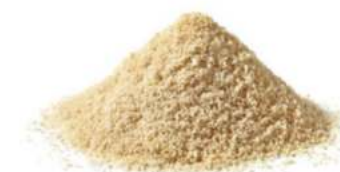
שקד טבעי טחון 11.35 / 1 ק"ג