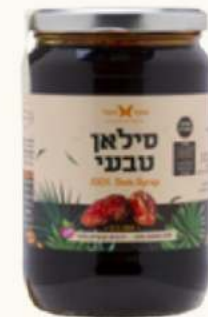
סילאן טבעי משפחתי מק"ט: 498221