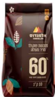
שוקולד מריר 60% 10 ק"ג