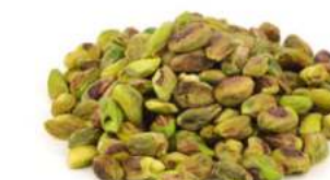
פיסטוק מקולף חצאים/שלם 13.65 / 1 ק"ג