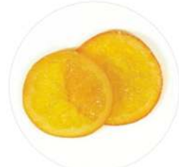
פלחי תפוז 5 ק"ג