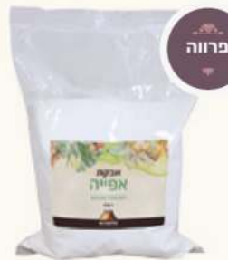
אבקות אפייה מק"ט: 228