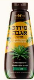
סירופ אגבה טבעי בקבוק לחיץ מק"ט: 3224