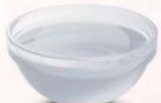
גלוקזה 25 ק"ג