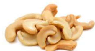
קשיו חצאים 22.7 / 1 ק"ג