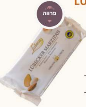
מרציפן ארוז LUBECA מק"ט: 1789