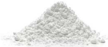
אבקת סוכר 10 / 1 ק"ג