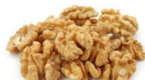
אגוז מלך 11.35 / 1 ק"ג