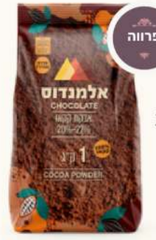
אבקות קקאו 20%-22% מק"ט: 655 / 3688