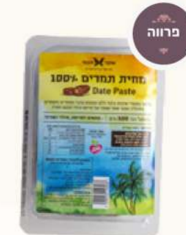
תמר כבוש מק"ט: 146066