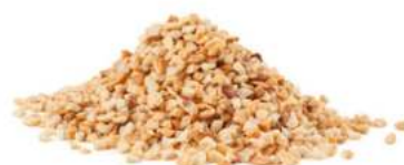
קרוקנט בוטנים 1 ק"ג במארז 10 ק"ג