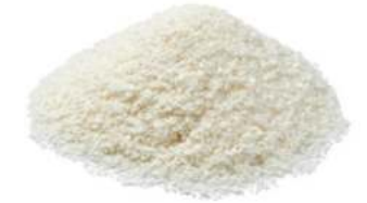
קוקוס טחון 25 / 1 ק"ג