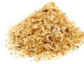
קוקוס קלוי 15 / 1 ק"ג