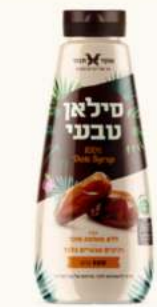
סילאן טבעי בקבוק לחיץ מק"ט: 3222