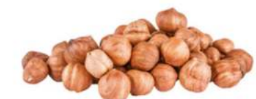
אגוז לוז טבעי גדול 14-16 מ"מ 10 / 1 ק"ג