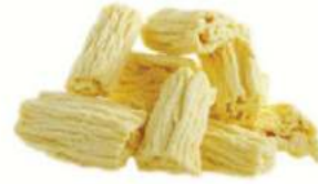
מקופלת לבן 5 ק"ג