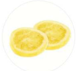
פלחי לימון 5 ק"ג