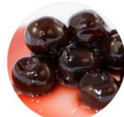
דובדבן אמרנה 60% 2.7 ק"ג / 1