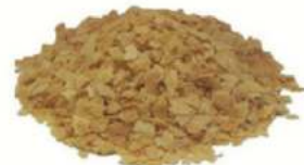
פייטה 2.5 / 1 ק"ג