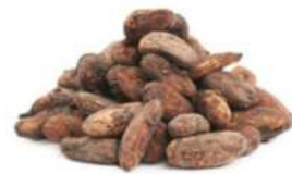
פולי קקאו שלמים אורגני נא 25 ק"ג