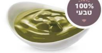
100% טבעי ROASTED חמאת פיסטוק 5 / 1 ק"ג