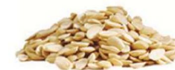
שקד חצאים 11.35 / 1 ק"ג