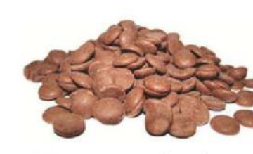
שוקולד חלב 35% מטבעות 1 / 2.5 / 10 ק"ג