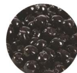
דובדבן שחור 10 ק"ג