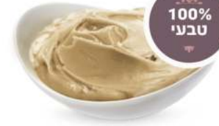
100% טבעי חמאת קשיו טבעי / קלוי 18 / 5 ק"ג