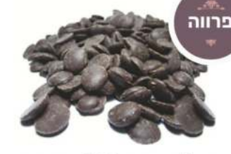
שוקולד מריר 60% מטבעות 1 / 2.5 / 10 ק"ג