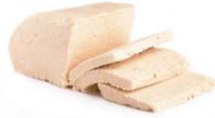
בלוק חלבה וניל 3 ק"ג