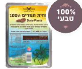
100% טבעי תמר כבוש פרימיום 500 גרם / 20 ק"ג