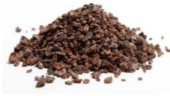
פולי קקאו גרוסים קלוי 1 ק"ג