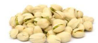
פיסטוק עם קליפה 11.35 ק"ג