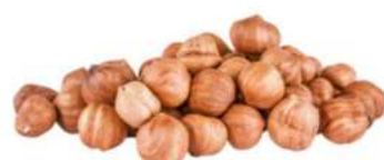
אגוז לוז טבעי קטן 9-11 מ"מ 10 / 1 ק"ג