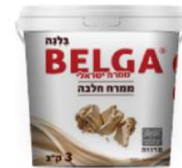
BELGA 6 ק"ג