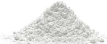
אינסטנט פודינג וניל 1 ק"ג