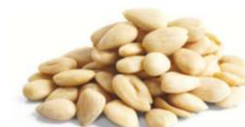
שקד מולבן שלם 11.35 / 1 ק"ג