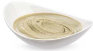
טחינה גולמית 18 / 5 ק"ג