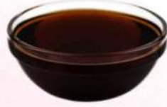
סילאן טבעי ללא סוכר 25 ק"ג