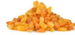
צימוק לבן 12.5 / 1 ק"ג