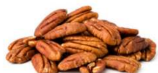
פקאן קלוי 13.65 / 1 ק"ג