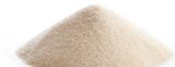
פקטין 1 ק"ג