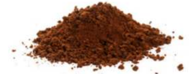
N11N אבקת קקאו טבעי 25 ק"ג