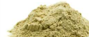
אבקת מאקה 20 ק"ג