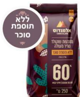
שוקולד מריר 60% ללא תוספת סוכר 10 ק"ג