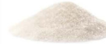
סוכר וניל 10 / 1 ק"ג