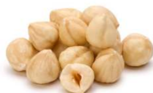
אגוז לוז מולבן 11-13 10 / 1 ק"ג