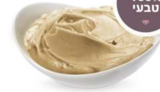
100% טבעי חמאת שקדים טבעי / קלוי 18 / 5 ק"ג