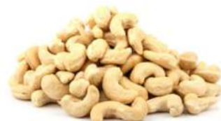
קשיו טבעי שלם - 240 22.7 ק"ג