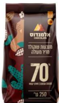
שוקולד מריר 70% 10 ק"ג