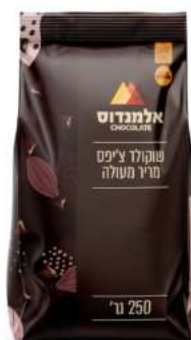
שוקולד מריר צ'יפס 10 ק"ג